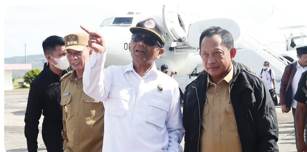
KUNKER MENKO POLHUKAM DI ACEH

Menko Bidang Politik, Hukum, dan Keamanan (Menko Polhukam) Mahfud MD (tengah) bersama Menteri Dalam Negeri (Mendagri) Muhammad Tito Karnavian (kanan) dan Pj Gubernur Aceh Achmad Marzuki (dua kiri) pada kunjungan kerja (kunker) di Bandara Internasional Sultan Iskandar Muda, Aceh Besar, Aceh, Rabu (21/12). Pada kunker selama dua hari di Kota Banda Aceh dan Kota Sabang, Menko Polhukan didampingi Mendagri mengunjungi dan mengecek kondisi pulau Rondo yang merupakan salah satu dari 11 Pulau-Pulau Kecil Terluar (PPKT) yang berbatasan dengan negara India dan Thailand.